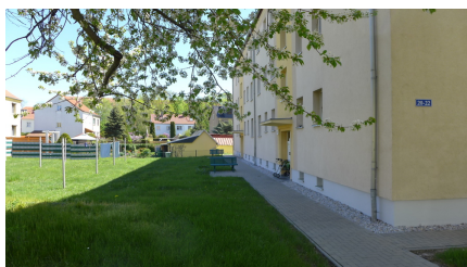
Ansicht Außenbereich des Gebäudes